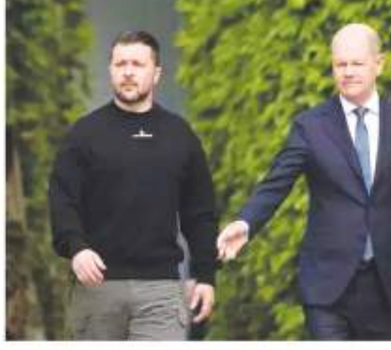
पर स्वागत किया। जेलेंस्की यूक्रेन पर रूस के हमले के बाद पहली बार जर्मनी

बर्लिन। यूक्रेन के राष्ट्रपति वोलोदिमीर जेलेंस्की ने कहा कि उनका देश रूस के कब्जे वाले यूक्रेनी क्षेत्रों को आजाद करवाने के लिए जवाबी हमले की तैयारी कर रहा है, लेकिन इसका लक्ष्य रूसी क्षेत्रों को निशाना बनाना नहीं है। यूक्रेन के राष्ट्रपति जेलेंस्की बर्लिन में जर्मन चांसलर ओलाफ शोल्ट्स के साथ एक संवाददाता सम्मेलन को संबोधित कर रहे थे। जेलेंस्की ने कहा कि यूक्रेन का लक्ष्य अंतरराष्ट्रीय स्तर पर मान्यता प्राप्त अपनी सीमाओं के भीतर के क्षेत्रों को मुक्त कराना है। वहीं, शोल्ट्स ने जेलेंस्की से कहा कि जर्मनी जब तक आवश्यक हो यूक्रेन का समर्थन करेगा। इससे पहले दिन में जर्मनी के चांसलर ने जेलेंस्की का बर्लिन पहुंचने पर स्वागत किया। जेलेंस्की यूक्रेन पर रूस के हमले के बाद पहली बार जर्मनी