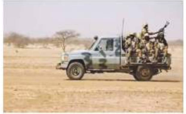
हमलावर मोटरसाइकिल पर आए थे और उनके पास खतरनाक हथियार भी थे। हमलावरों ने अधाधुध फायरिंग शुरू कर दी