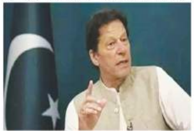
काइन का सहरा लिया जा रहा है। इमरान खान ने कहा कि सार्वजनिक प्रतिक्रिया से बचने के लिए सेना ने दो काम किये। पहला काम पीटीआई कार्यकर्ताओं के साथ आम लोगों में अटक फैलाया और दूसरा काम मीडिया पर पूरी तरह नियंत्रण स्थापित कर लिया गया। उन्होंने सेना पर लोगों के घरों

इस्लामाबाद। पाकिस्तान के पूर्व प्रधानमंत्री इमरान खान ने आरोप लगाया है कि पाकिस्तानी सेना उन्हें देशद्रोह के आरोप में फंसकर अगले दस साल तक जेल में रखना चाहती है। इमरान ने ट्वीट कर इसे लंदन योजना यानी पूर्व प्रधानमंत्री नवाज शरीफ की योजना करार दिया। पाकिस्तान के पूर्व प्रधानमंत्री और पाकिस्तान त्हरोक-ए-इस्लाफ पार्टी के प्रमुख इमरान खान ने अपने लाहौर स्थित आवास पर पार्टी नेताओं के साथ बैठक कर आगे की रणनीति बनाई। बैठक के बाद ट्वीट कर उन्होंने पाकिस्तानी सेना पर गंभीर आरोप लगाए। इमरान ने कहा कि यह सब उस लंदन योजना के तहत हो रहा है, जो पूर्व प्रधानमंत्री नवाज शरीफ ने लंदन में बैठकर बनाई है। इमरान ने आरोप लगाया कि उनकी बेगम बुशरा को जेल भेजने की योजना है, जिससे उन्हें अपमानित किया जा सके। साथ ही अगले 10 वर्षों के लिए उन्हें जेल में रखने के लिए देशद्रोह को तोड़ने और महिलाओं के साथ मारपीट करने के भी आरोप लगाए।